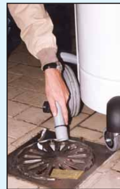
Tubo di scarico liquidi (solo mod. 802) Tubo para descarga líquidos (model 802)