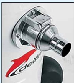
Bocchettone alluminio presso fuso Boca en aluminio fundido a presión