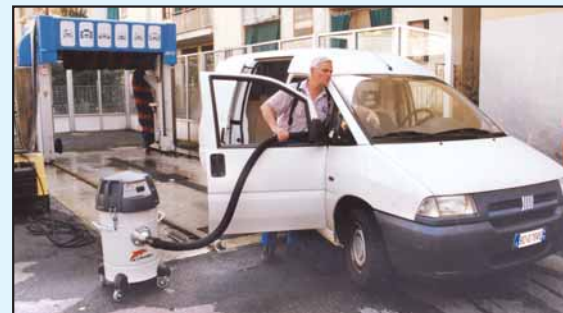
Impianti di lavaggio e carrozzerie Autolavados y mantenimiento coche