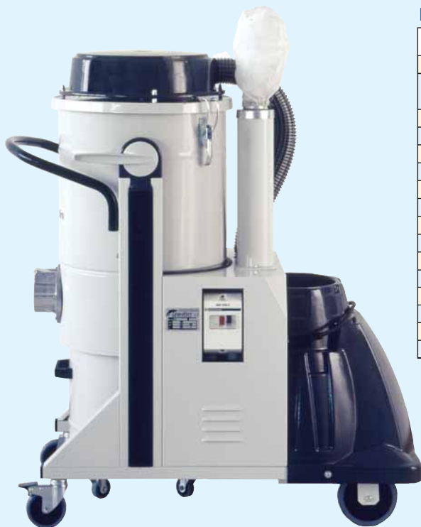
Dati tecnici / Datos técnicos Mistral TRIFASE • Mistral TRIFÁSICO